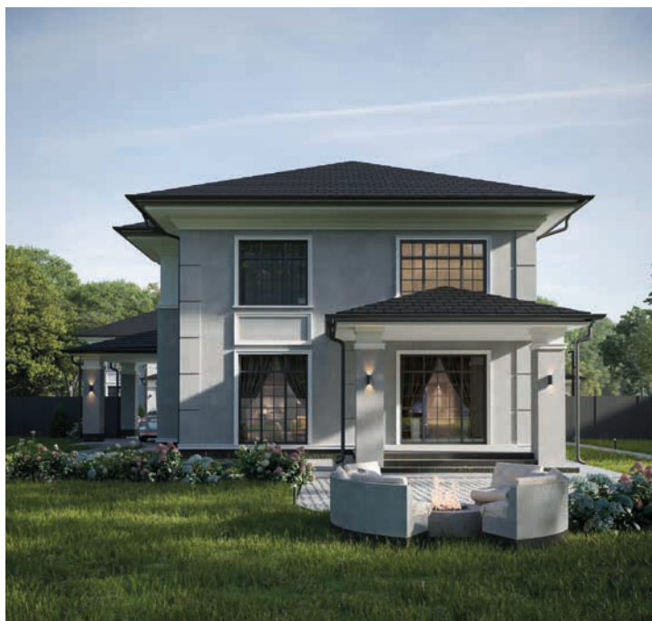
ПРОЕКТЫ ДОМОВ КОМЬЮНИТИ