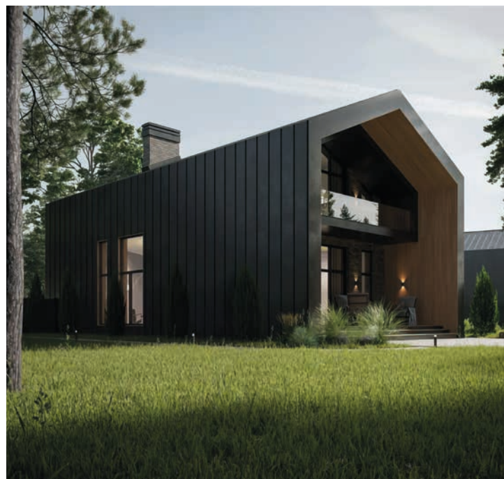
ПРОЕКТЫ ДОМОВ КОМЬЮНИТИ