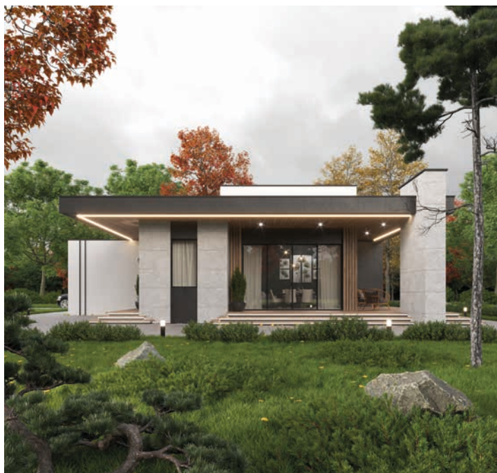
ПРОЕКТЫ ДОМОВ КОМЬЮНИТИ